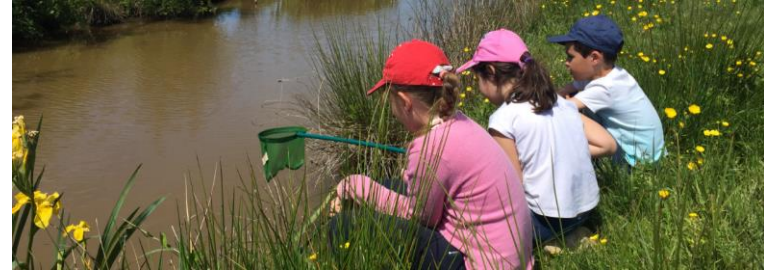
Projet « reconnecter les jeunes à la nature »